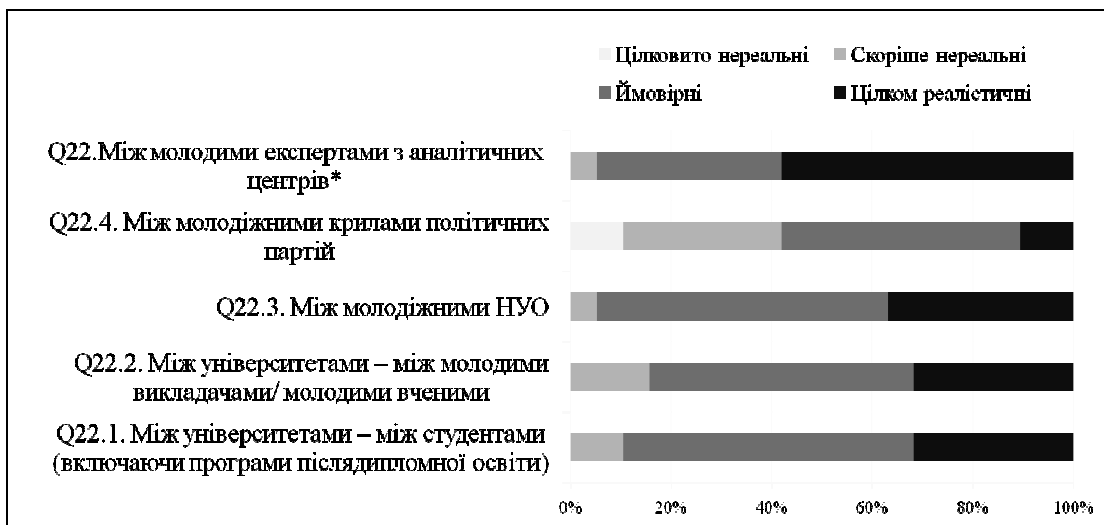
Рис 2. Перспективи залучення молоді до співпраці між Україною та Румунією

Зважаючи на низьку оцінку експертами впливовості молоді на двосторонні відносини, особливо цінними є різні формати молодіжної співпраці між Румунією та Україною у найближчому майбутньому. Так, по 95% респондентів оцінюють співпрацю між молодими експертами з аналітичних центрів та між молодіжними НДО або як досить ймовірну, або навіть цілком реалістичну. При цьому, більшість експертів (58%) саме співпрацю між молодими аналітиками з think-tanks вбачає як цілком реалістичну. Щодо академічної сфери України та Румунії, то в реальний потенціал студентських обмінів та програм співпраці для молодих викладачів/ молодих вчених вірить третина респондентів (по 31%), та ще 52-58% експертів вважають співпрацю в академічній сфері ймовірною. Найменше вірять у реалістичність співпраці між молодіжними крилами політичних партій – цей формат 42% експертів оцінюють як цілковито/скоріше нереальний.